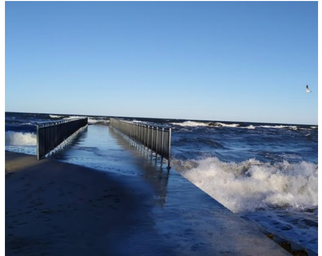
Wylot na wysokości ośrodka ARKA MEGA w Kołobrzegu