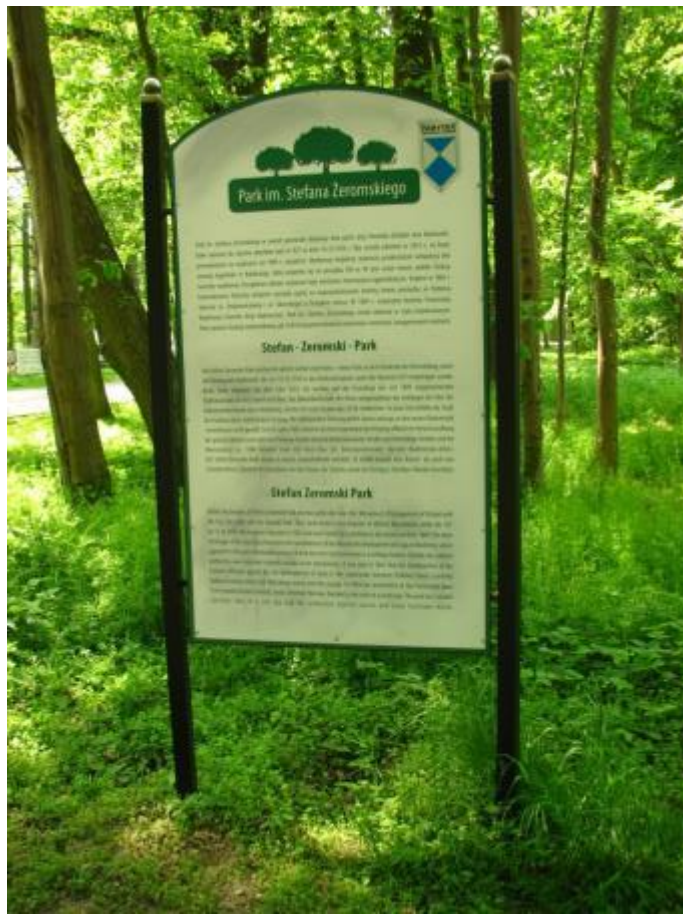
Tablica w Parku im. S. Żeromskiego, okolica Kamiennego Szańca Tablica w bardzo dobrym stanie, lekko brudna