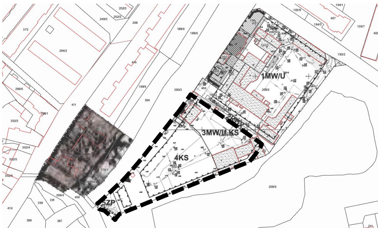
Rysunek miejscowego planu zagospodarowania przestrzennego obejmującego tereny pomiędzy ul. Bogusława X a ul. Kamienną ■■■■■ granice terenu objętego proponowaną zmianą planu miejscowego

Rada Miasta Kołobrzeg 30 stycznia 2014 r. podjęła Uchwałą Nr XLII/559/14 w sprawie miejscowego planu zagospodarowania przestrzennego części obszaru miasta Kołobrzeg obejmującego tereny pomiędzy ul. Bogusława X a ul. Kamienną obejmującą m.in. działki stanowiące własność Gminy Miasto Kołobrzeg o nr 177/1, 203/3 i 203/4 położone w obrębie 13 przy ul. Kamiennej. Teren tych działek oznaczono na rysunku ww. planu miejscowego symbolami 2KDX teren ciągu pieszego, 3MW/U,KS teren zabudowy mieszkaniowo-usługowej i obsługi komunikacji, 4KS teren obsługi komunikacji oraz 5ZP teren zieleni parkowej.