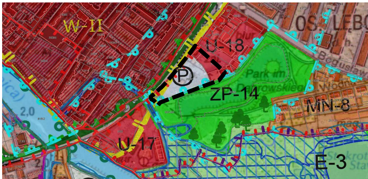
Fragment zał. nr 3 do studium – kierunki zagospodarowania przestrzennego

Na obszarze miasta Kołobrzeg obowiązuje Studium uwarunkowań i kierunków zagospodarowania przestrzennego miasta Kołobrzeg przyjęte Uchwałą Nr XXXIV/466/13 Rady Miasta Kołobrzeg z dnia 12 czerwca 2013 r., zmienione Uchwałą Nr XLI/631/18 Rady Miasta Kołobrzeg z dnia 27 marca 2018 r. Niniejsza analiza ocenia stopień zgodności przewidywanych rozwiązań zmiany mpzp ze studium. Obszar objęty sporządzaniem zmiany planu znajduje się na terenach oznaczonych w studium symbolami: w części U-18 oraz literą P w kółku.