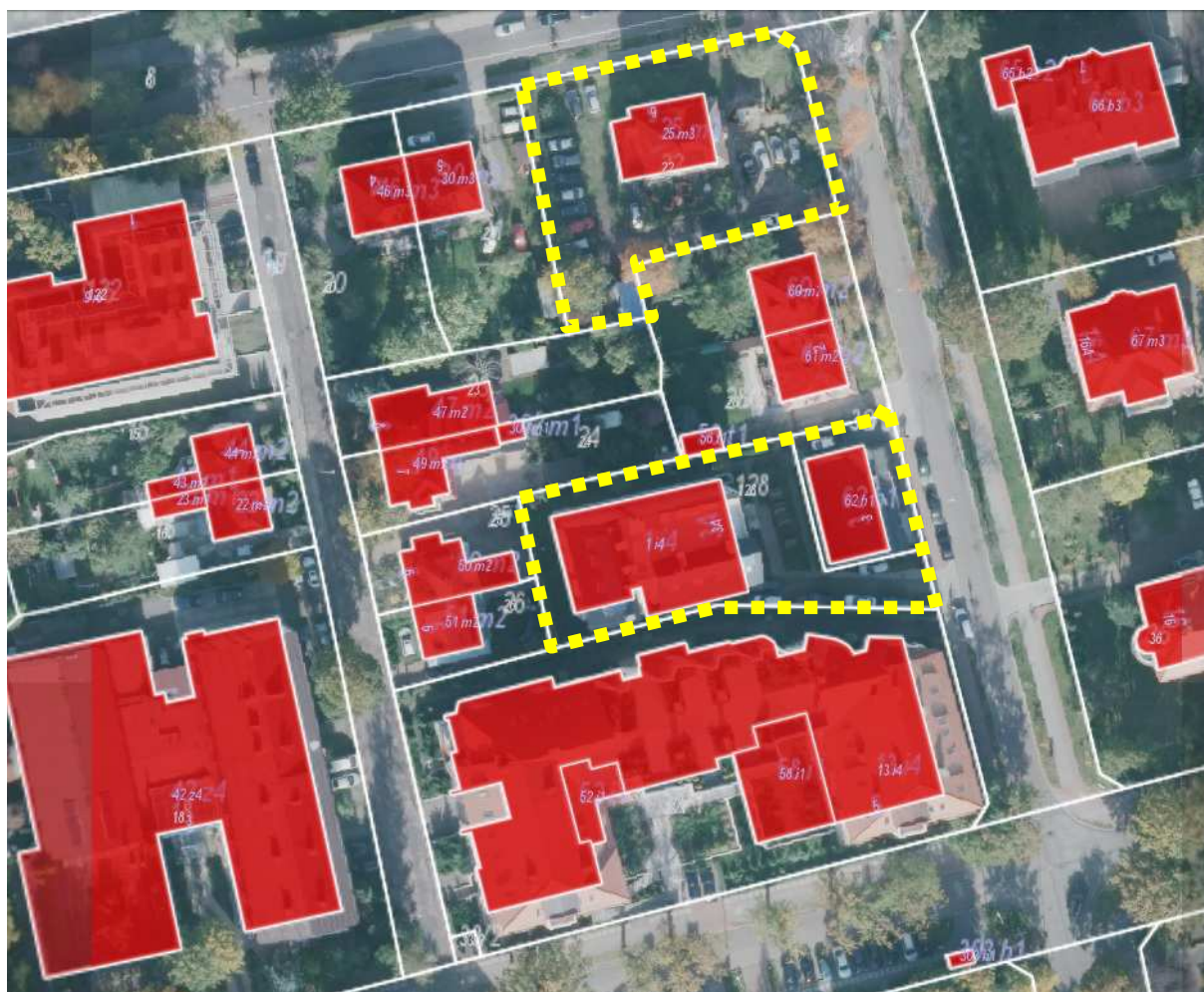
Fragment ortofotomapy i mapy ewidencyjnej

■ ■ ■ ■ ■ ■ ■ ■ ■ ■ granice terenów proponowanych do objęcia zmianą planu miejscowego