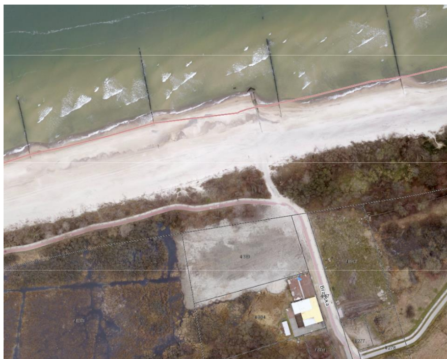
Widok z gór – wejście na plażę w ciągu ul. Brzeskiej