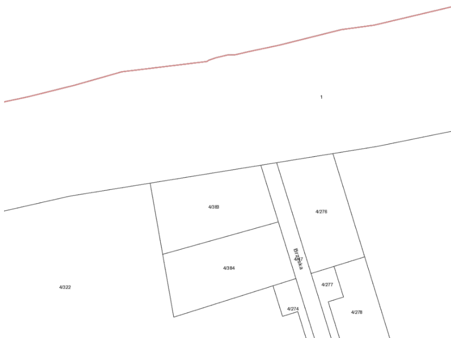
Plan sytuacyjny dz. nr 1 i 4/47 oraz wody przybrzeżne morza Bałtyckiego w obrębie 8 miasta Kołobrzeg

Proponowana lokalizacja obiektu - zejście (okolicę zejścia) na plażę na przedłużeniu ul. Brzeskiej w Podczelu dz. nr 1 i 4/47 oraz wody przybrzeżne morza Bałtyckiego w obrębie 8 miasta Kołobrzeg.