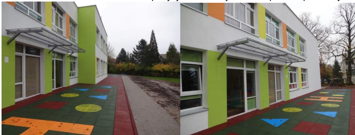
Elewacja południowa z nawierzchnią tartanową.

W 2016 r. wykonywane były na obiekcie roboty związane z: termomodernizacją (docieplenie ścian styropianem i stropodachu granulatem z wełny mineralnej, wymiana instalacji c.o. i modernizacja wymiennikowni) oraz remontem i przebudową budynku celem dostosowania obiektu do zaleceń ekspertyzy technicznej ds. zabezpieczeń pożarowych.