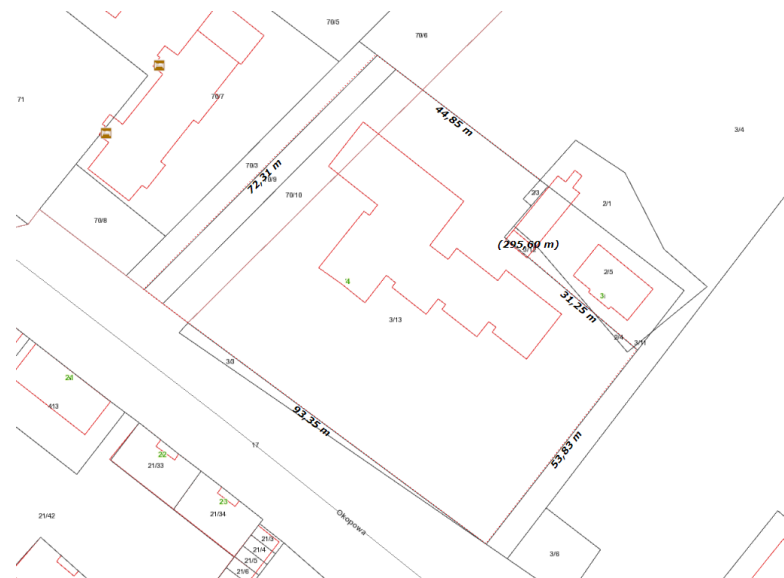
Mapa pogładowa terenu