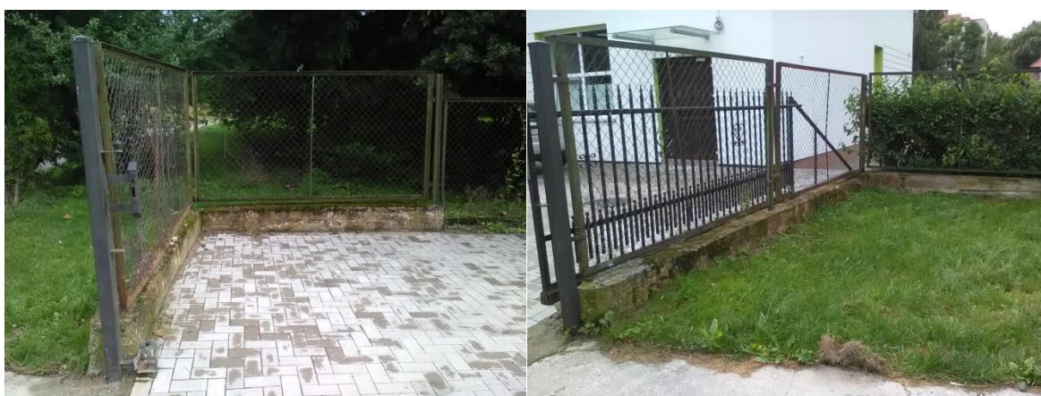
Szczegóły zamocowania słupków istniejącej bramy przesuwnej