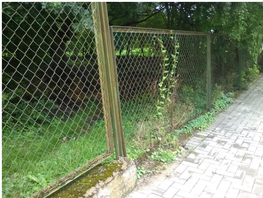
Ogrodzenie i istniejący cokół o zróżnicowanej wysokości