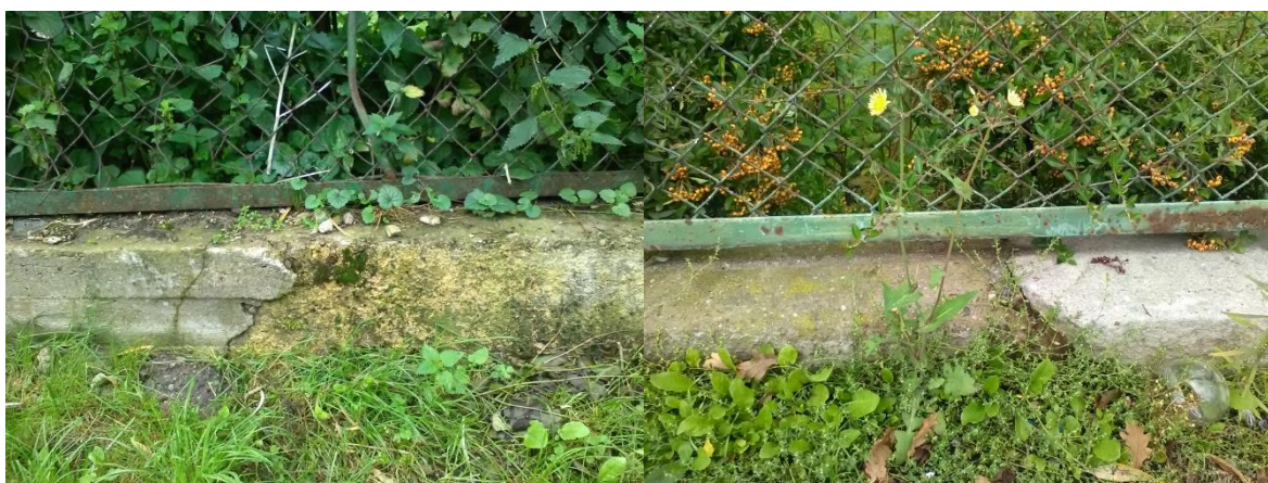
Uszkodzenia istniejącego cokołu