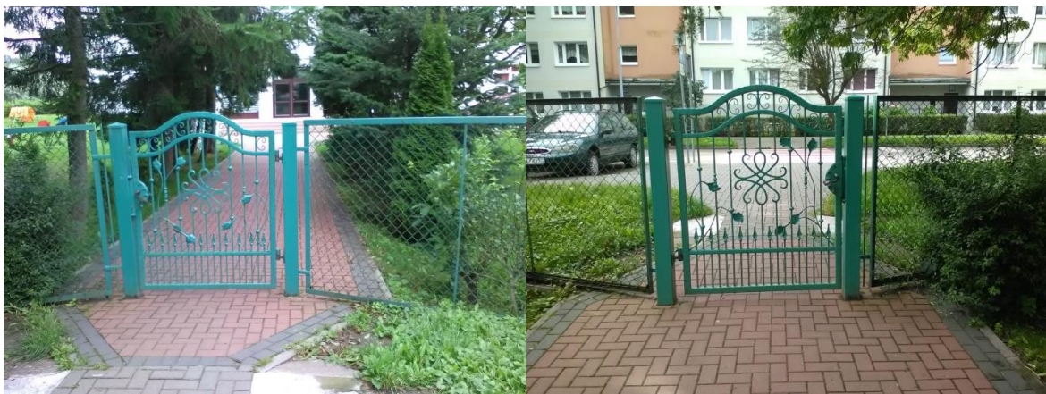
Furtka wejściowa od ul. Okopowej