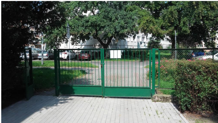
Brama z furtką