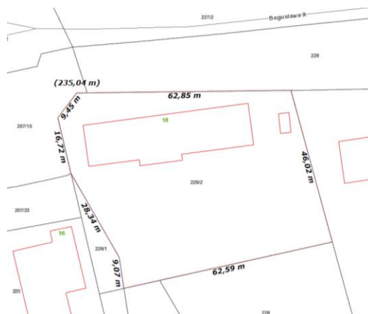
Mapa pogładowa terenu