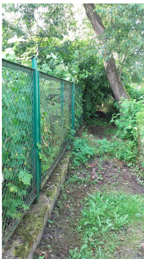
Istniejące ogrodzenie na cokole betonowym