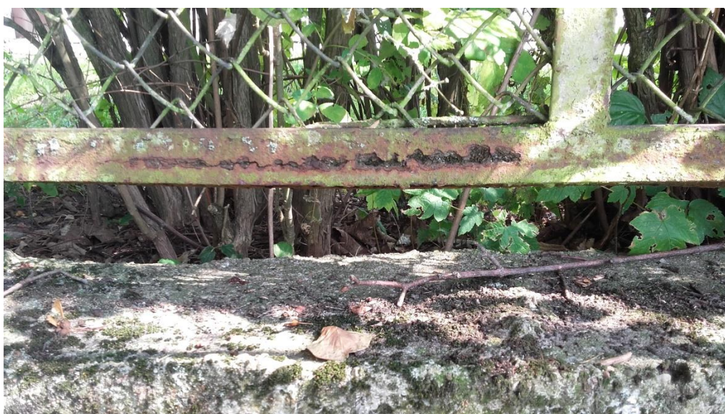
Uszkodzenia istniejącego cokołu