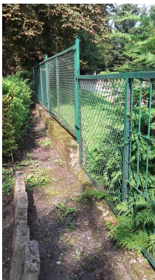
Ogrodzenie i istniejący cokół o zróżnicowanej wysokości