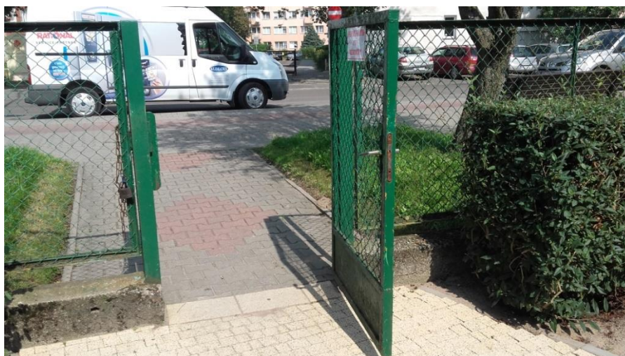
Furtka wejściowa - główna