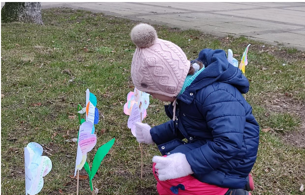
Zdjęcie 7 Sadzenie kwiatków na Rabacie Konsultacyjnej