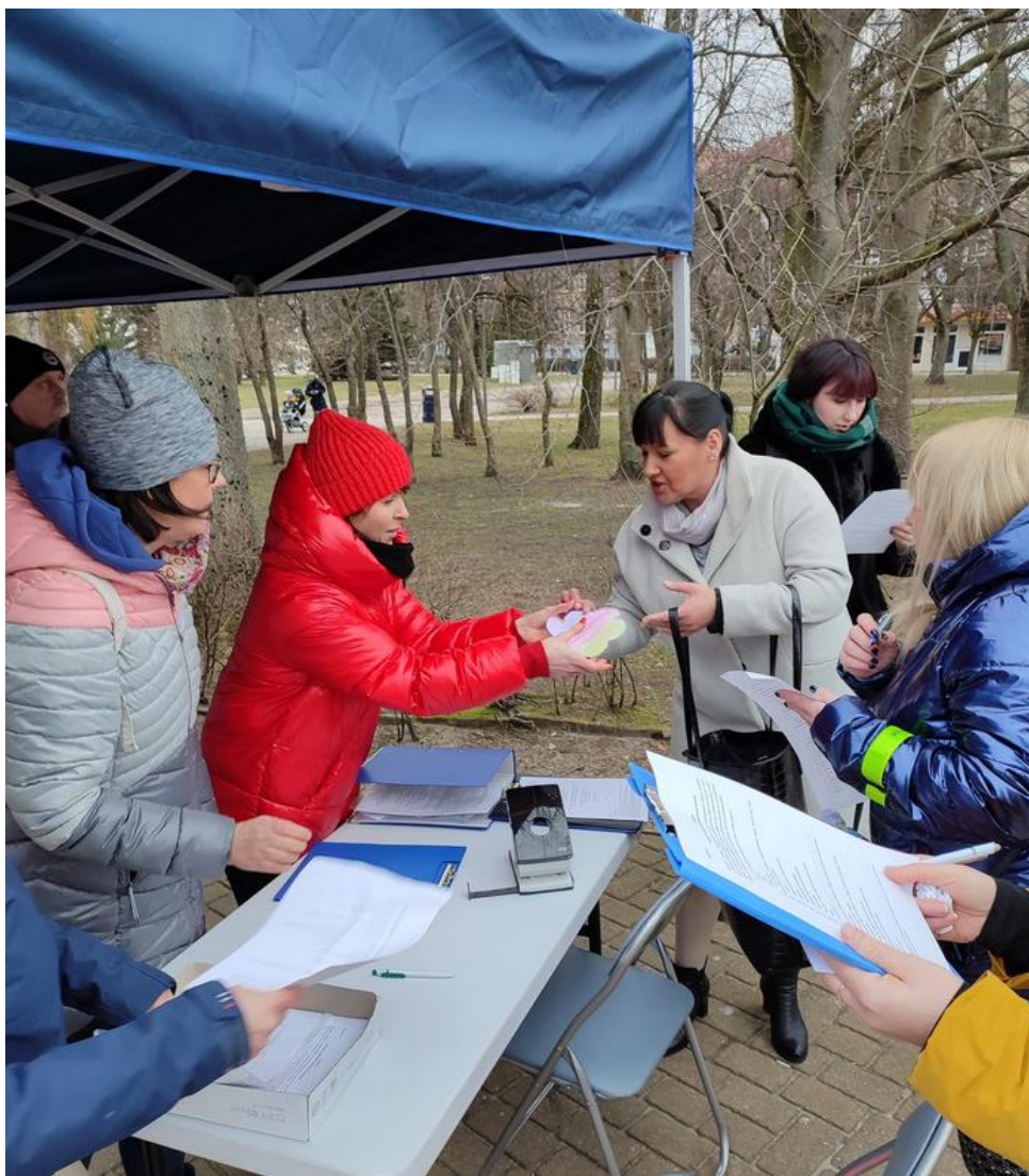
Zdjęcie 5 Stoisko Konsultacyjne

Uczestnik otrzymywał na stoisku potwierdzenie nadania identyfikatora i mógł zasadzić swojego kwiatka na Rabacie Konsultacyjnej.