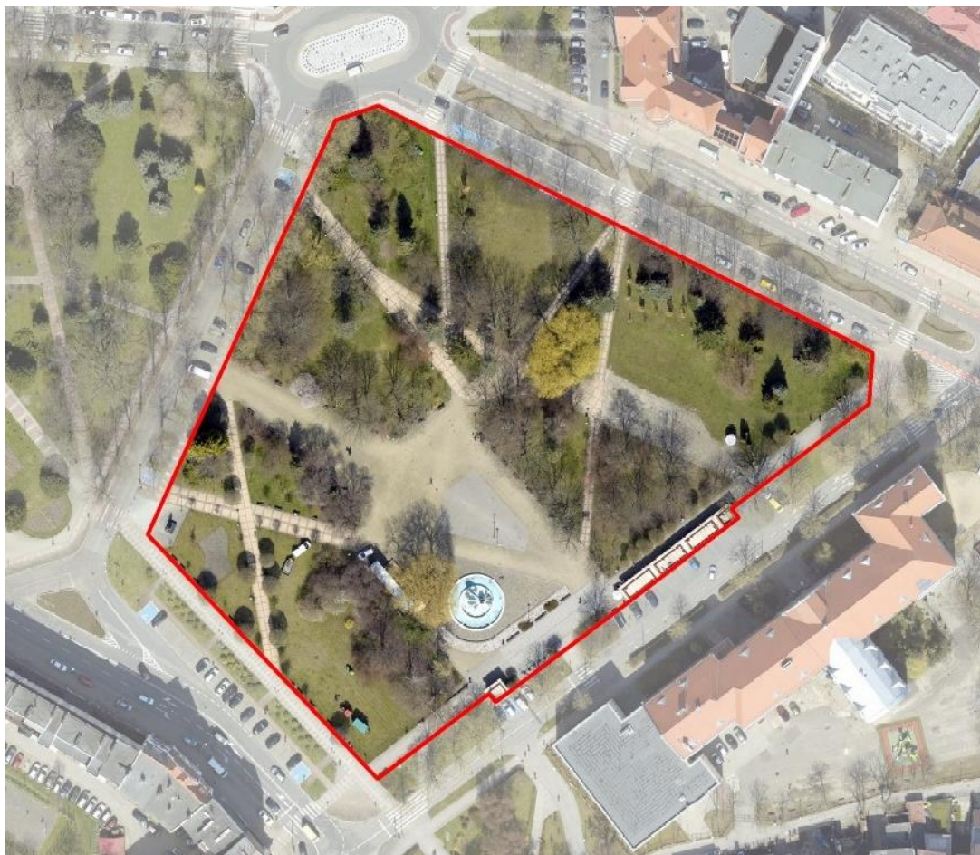
Kołobrzeg marzec 2022 r.