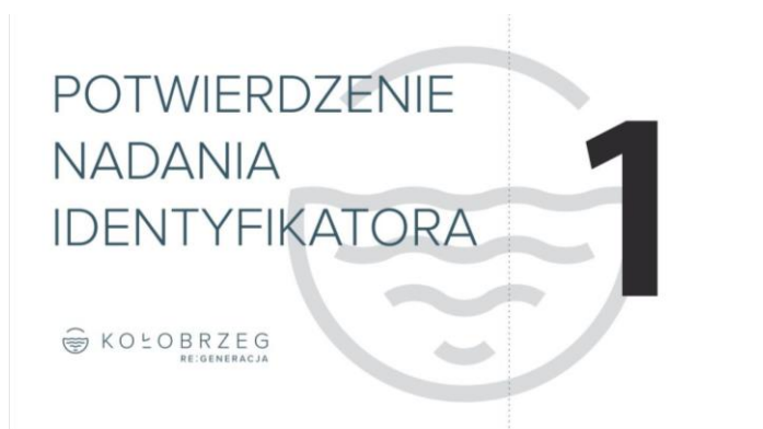
Zdjęcie 6 Wzór potwierdzenia nadania identyfikatora, który otrzymywał każdy uczestnik konkursu

Uczestnik otrzymywał na stoisku potwierdzenie nadania identyfikatora i mógł zasadzić swojego kwiatka na Rabacie Konsultacyjnej.