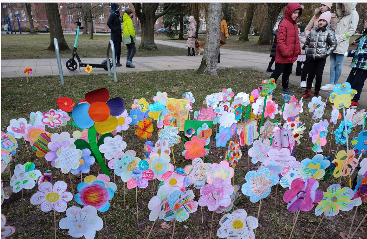
Zdjęcie 8 Rabata Konsultacyjna

Podczas spotkania konsultacyjnego zebrano 195 ankiet.