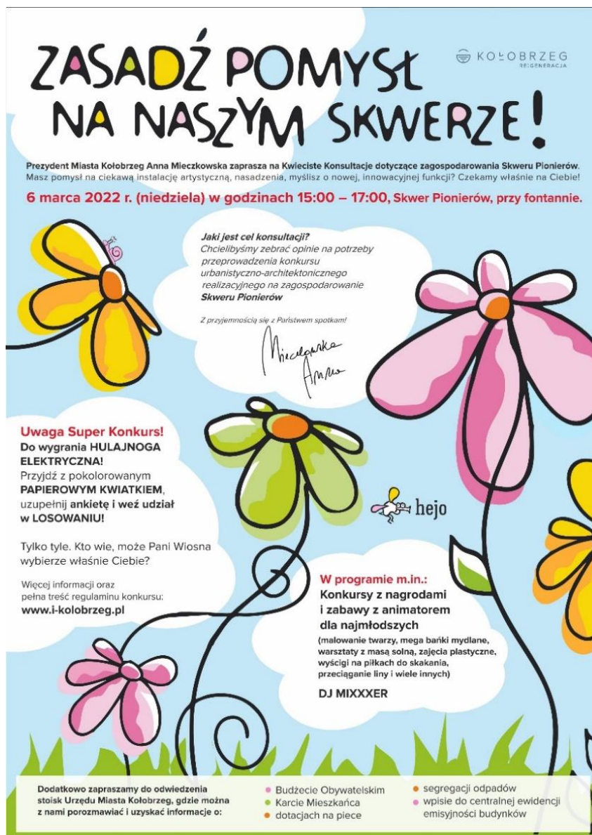
Zdjęcie 3 Plakat reklamujący Kwieciste Konsultacje na Skwerze Pionierów

Dodatkowo Prezydent Miasta Kołobrzeg zaprosiła drogą mailową do udziału w spotkaniu konsultacyjnym radnych Rady Miasta Kołobrzeg, członków Zespołu zadaniowego ds. estetyzacji miasta, Komitetu Rewitalizacji, Kołobrzesckiej Izby Gospodarczej, Regionalnego Stowarzyszenia Turystyczno-Uzdrowiskowego, Klubu Pioniera oraz Projekt Kołobrzeg.