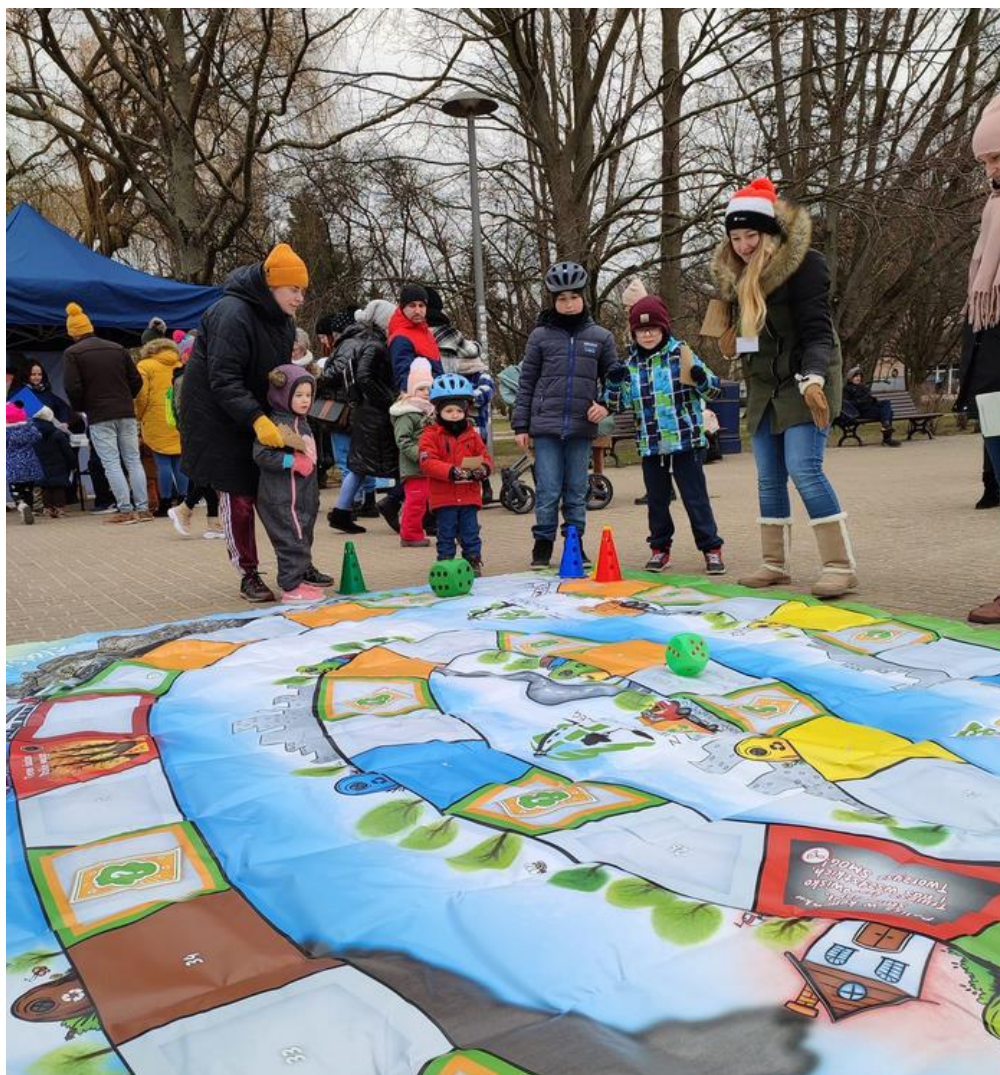
Zdjęcie 4 Kwieciste Konsultacje 6 marca 2022 r.

Spotkanie konsultacyjne na Skwerze Pionierów było zorganizowane jako wiosenny event pod nazwą „Kwieciste Konsultacje”. W ramach wydarzenia zaplanowano zabawy z animatorem dla dzieci, oprawę muzyczną DJ MAXXX-a, możliwość porozmawiania z urzędnikami i uzyskania informacji o budżecie obywatelskim, karcie mieszkańca, segregacji odpadów, dotacji na piece oraz o wpisie do centralnej ewidencji emisyjności budynków.