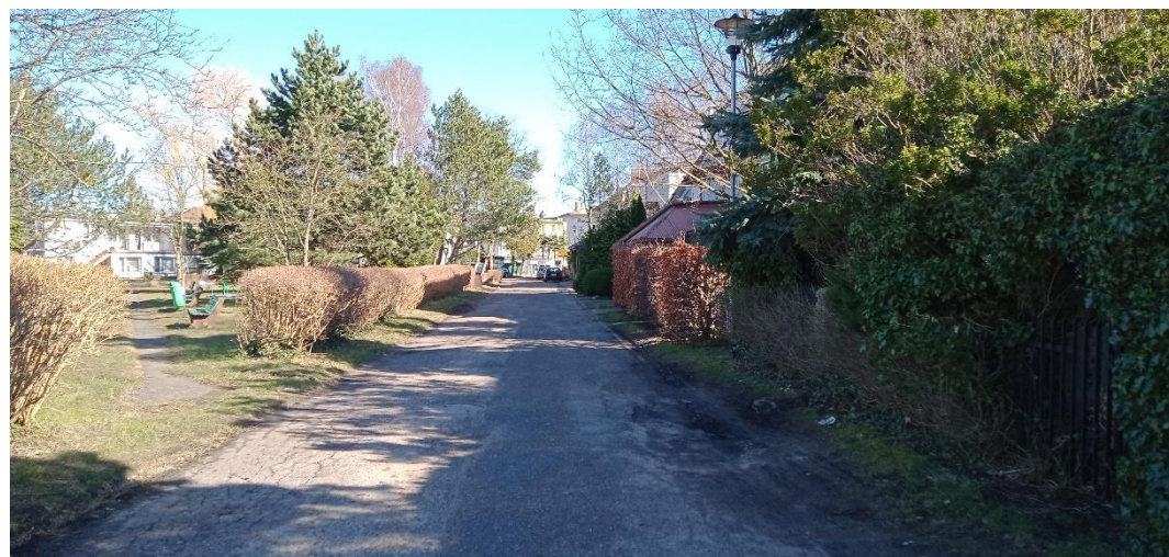
ul. Pierwszych Osadników