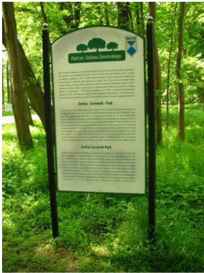
Tablica przy kortach tenisowych, Tablica w bardzo dobrym stanie