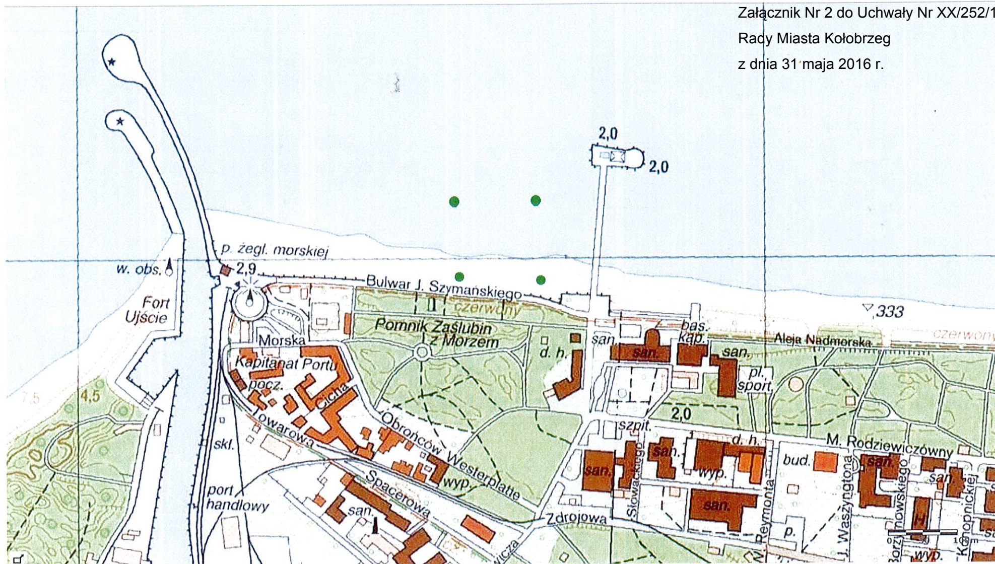
Kołobrzeg Plaża Centralna